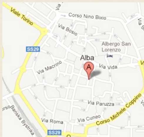
Salone Casa Opere Diocesane, V. Mandelli 9, Alba (CN)

4 incontri previa iscrizione su: anziani, minori, handicap, psichiatria. Gli approfondimenti tematici saranno individuati dagli operatori stessi della cooperativa.